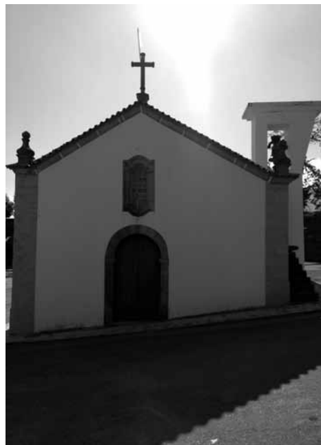
Fig. 6 - Santuário de Nossa Senhora do Viso

e coberturas com telhados de duas águas. O conjunto arquitetónico é rebocado e pintado a branco. As fachadas são rematadas em friso e cornija, na capela-mor, e apenas friso na nave. A fachada posterior, cega, é coroada com cruz latina. Nesta destacamos as pilastras toscanas coroadas por pináculos. A fachada principal de pano único com portal principal encimado por janela termina em empena coroada por cruz latina de secção circular. O portal com arco de volta inteira, biselado, assenta em pilastras que formam falsos colunelos. Este é encimado por janela de com moldura em granito de topos curvos.