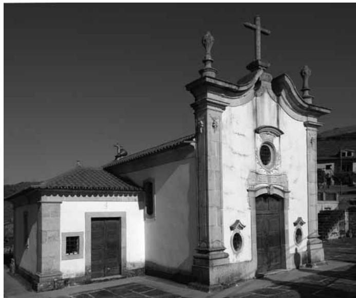
Fig. 2 - Santuário de Santa Eufémia

principal, surgem duas gárgulas para descarga das águas pluviais. No mesmo plano, rasga-se uma janela, polilobada com mainel e moldura em cantaria decorada com motivos geométricos.