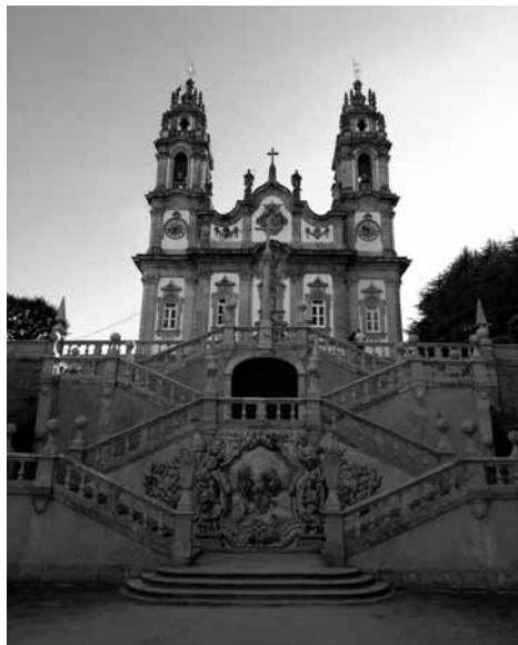
Fig. 1 - Santuário de Nossa Senhora dos Remédios

vegetalistas. A encimar o portal pode observar-se um nicho com imagem da padroeira e acima interrompendo o entablamento um óculo. Ao nível do nicho, abrem-se quatro janelões com tímpanos triangulares curvos, também nas torres sineiras, decorados com molduras e aventais recortados com borlas e motivos vegetalistas. A empena é recortada e encimada por cruz latina. A rematar cada pilastra encontram-se estátuas de anjos e estátuas alegóricas. O pano central da empena ostenta o escudo real ladeado por anjos, festões e conchas nas laterais. As sineiras estão rematadas em coruchéu bolboso e fogaréus.