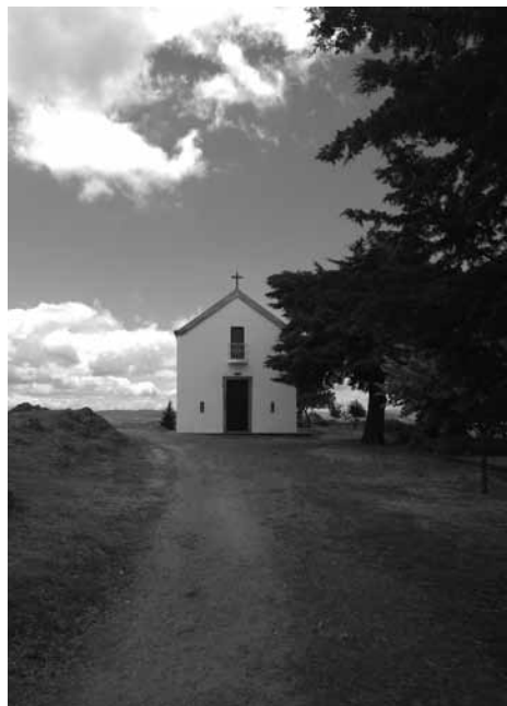
Fig. 5 - Santuário de São Leonardo de Galafura