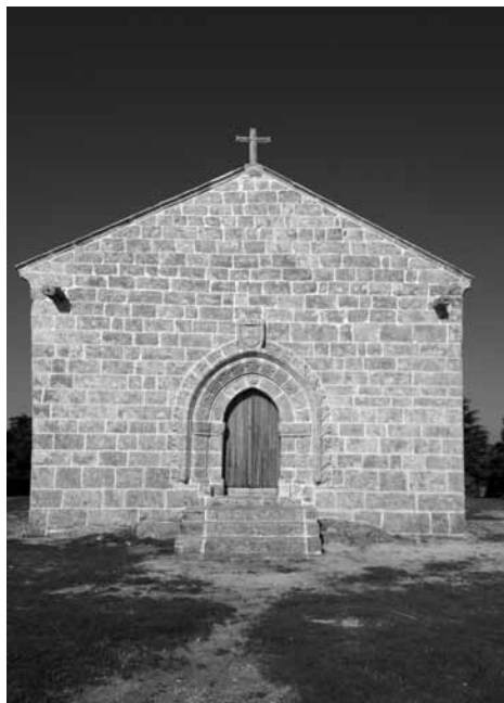
Fig. 3 - Santuário de São Domingos em pleno Alto Douro Vinhateiro