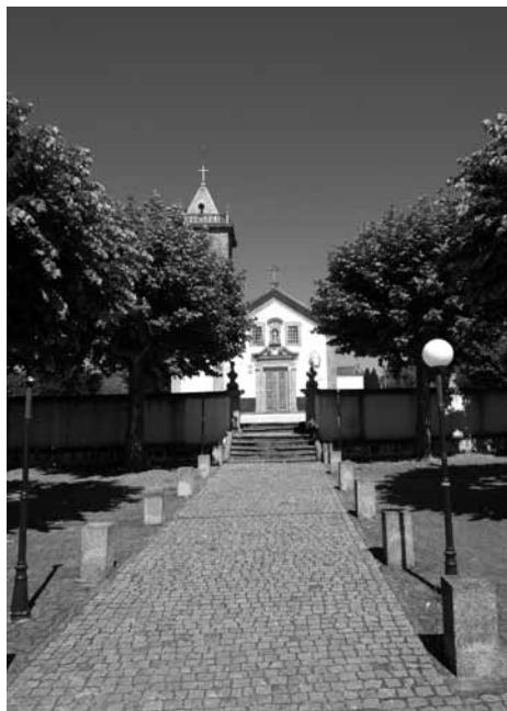
Fig. 4 - Santuário de Nossa Senhora das Candeia

e coroada com uma cruz latina. O portal principal simples, com moldura de granito encimado por cartela com a inscrição 1924. Este é ladeado por duas frestas verticais. A encimar o portal rasga-se uma janela e varandim com base circular e guarda de ferro. A fachada posterior é cega, rematada com a imagem de São Leonardo. Nesta imagem é apresentado um painel de azulejo com um poema de Miguel Torga.